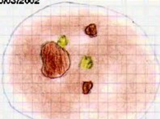
Bulbo di begonia visto dall'alto

Dalla terra affiorano due piccoli germogli di colore verde molto chiaro, uno è attaccato alla parte del bulbo che non è coperta dalla terra, l'altro invece è circondato di terra. Si vedono anche altre due puntine, queste sono però di colore marrone chiaro.